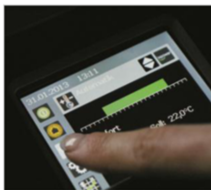
Ecran tactile - Un confort de vie et de chauffage avec une technologie de l'avenir.